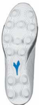
Dubbar av gummi